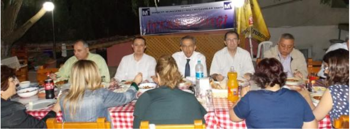
Acıpayam’da, Acıpayam – Tavas – Serinhisar - Çameli - Kale – Beyağaç Bölgesi’ndeki meslek mensuplarına yönelik “İftar Yemekleri” gerçekleştirildi.