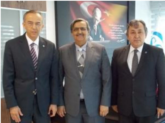
Sosyal Güvenlik Kurumu İl Müdürlüğü

Mali İdaremiz, Sosyal Güvenlik Kurumu İl Müdürlüğümüz, Çalışma ve İş Kurumu İl Müdürlüğümüz ile koordineli bir şekilde, Mali Tatilin sorunsuz uygulanması noktasında gerekli görüşmeler yapılmış ve tedbirler alınmıştır.