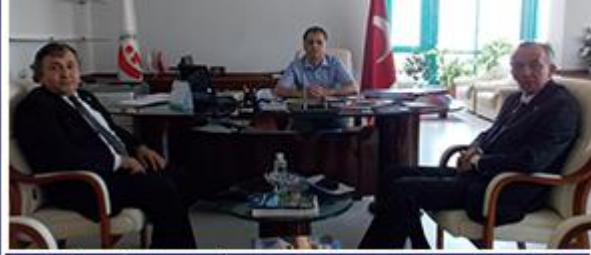
MALİ TATİL ÖNCESİ KURUMLARIMIZI ZİYARET EDİP GÖRÜŞMELER GERÇEKLEŞTİRDİK.