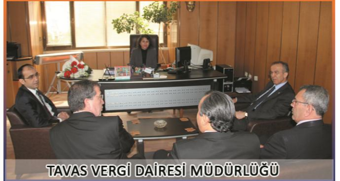
TAVAS VERGİ DAİRESİ MÜDÜRLÜĞÜ