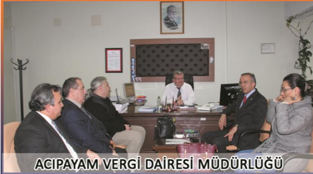
ACIPAYAM VERGİ DAİRESİ MÜDÜRLÜĞÜ