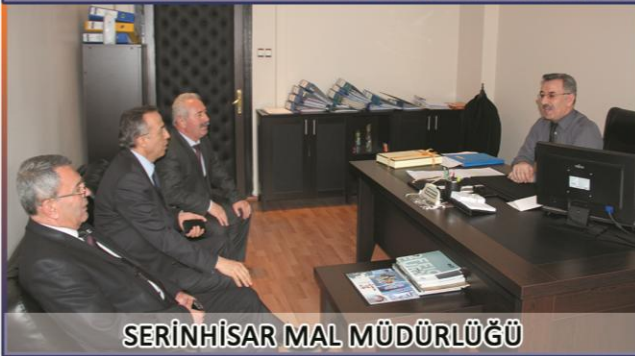
SERİNHİSAR MAL MÜDÜRLÜĞÜ