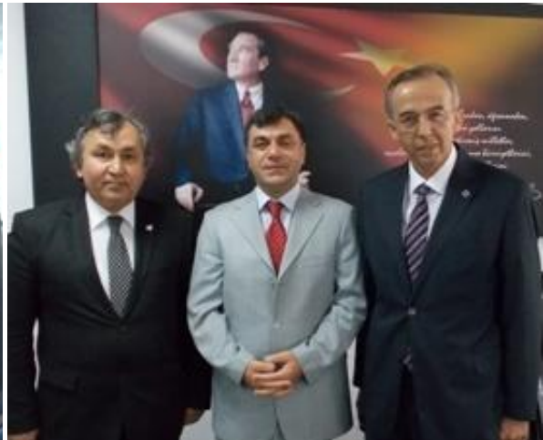
Çalışma ve İş Kurumu İl Müdürlüğü