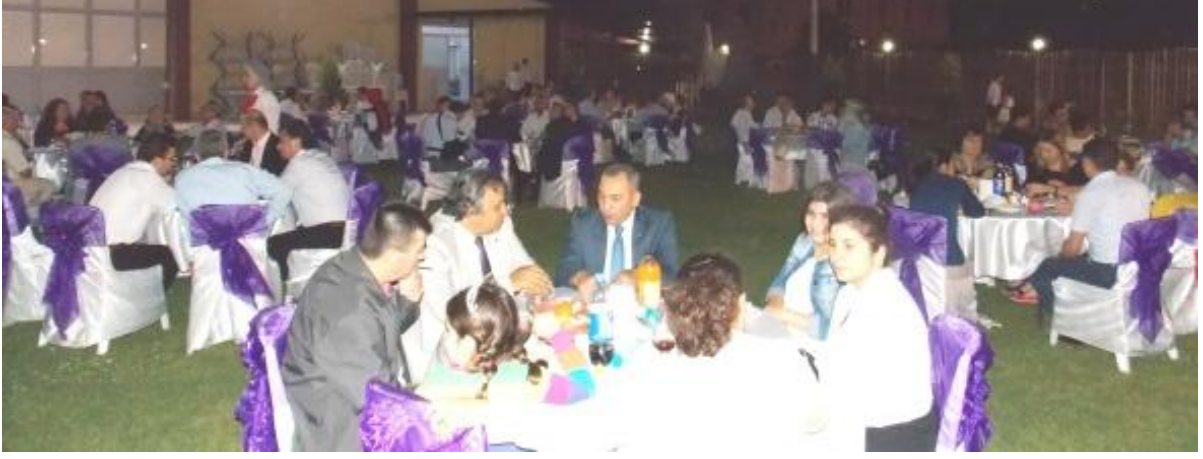
Buldan’da, Buldan – Sarayköy - Güney Bölgesi’ndeki

Ramazan Ayına özel etkinlikler kapsamında; Temmuz ayı içerisinde, Çivril’de, Çivril – Çal – Çardak – Bozkurt – Bekilli Bölgesi’ndeki