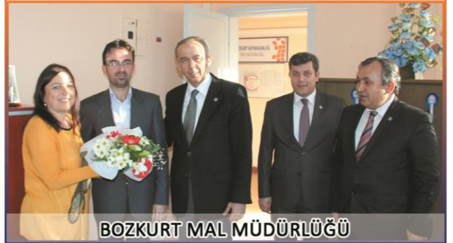
BOZKURT MAL MÜDÜRLÜĞÜ