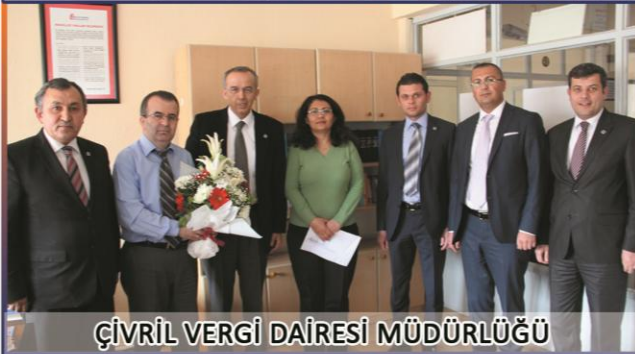
ÇİVRİL VERGİ DAİRESİ MÜDÜRLÜĞÜ