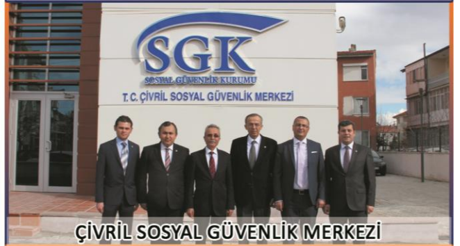
ÇİVRİL SOSYAL GÜVENLİK MERKEZİ